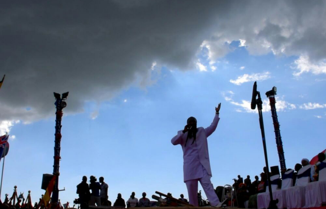
Gud, Han SjälV Kom Ned i ett Tjock Mörkt Moln över Hans Mäktiga Profet en upprepning från Andra Moseboken 19:16-18 (28 Augusti 2016, Nakuru Menengai Ground Kenya)