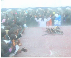
Helig Andes Regn föll från himlen som profeterat (Kisii, Kenya)