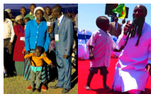
Crippled baby healed