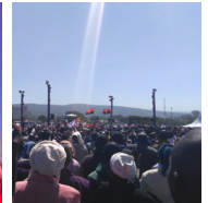
Pelare av Hans Härlighet (2016, Nakuru, Kenya)