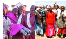
Chronic arthritis healed