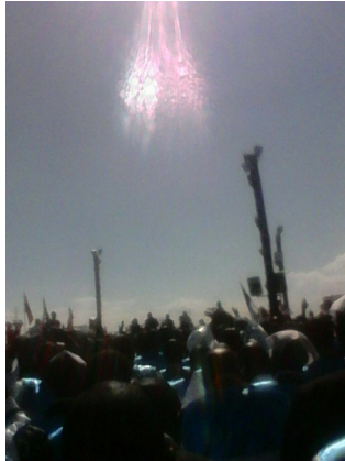
Profet Elia's Eld , en upprepning från Första Kungaboken 18:38 (27 augusti, 2016, Nakuru Menengai Ground, Kenya)