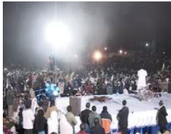
Shekinah Härlighet (Eldama Ravine, Kenya)