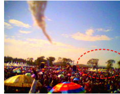
Gud Självt kom ned i Kisumu, Kenya (31 December, 2012)