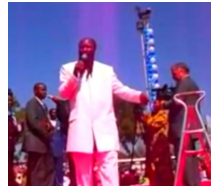
Pelare av Hans Härlighet (2013, Kakamega, Kenya)