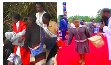
Spinal cord injury healed